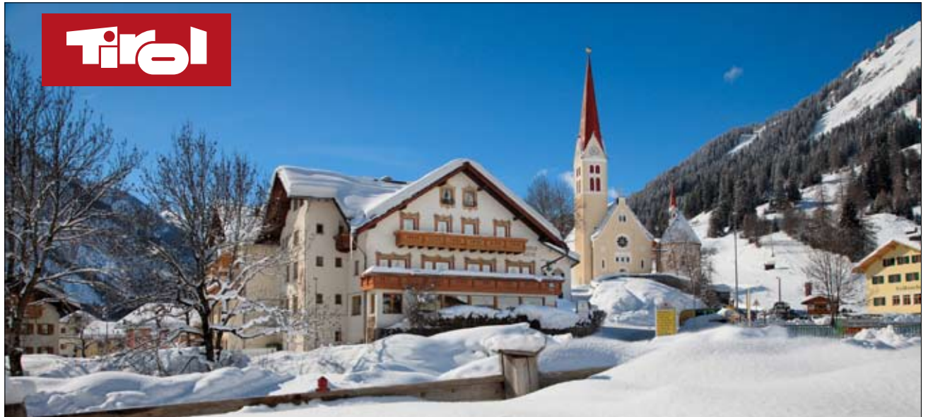
Gasthof Bären im Holzgau.

Die Landschaft wird jedoch nicht allein von Bergen und Pflanzen beherrscht, auch das Wasser spielt eine große Rolle. Eingebettet zwischen Allgäuer und Lechtaler Alpen liegt die alpine Wildflusslandschaft des Lech. Im Winter setzt man hier auf sanfte Freizeitangebote. Großdimensionierte Skigebiete im Tal gibt es nicht. Es sind kleine Lifte, die speziell Familien und Anfängern entgegenkommen. Könnern fahren ins 15 km entfernte Warth am Arlberg in das große