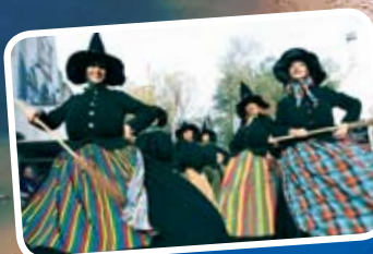
Bei der großen Halloween-Parade gehen riesige Kürbisse, Hexen und Gaukler auf Tour

BAD WÖRISHOFEN KNEIPP & THERMAL IM ALLGÄU