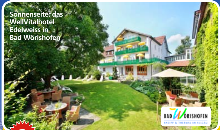
Sonnenseite: das WellVitalhotel Edelweiss in Bad Wörishofen

V erbringen Sie einen Kurzurlaub in einem der beliebtesten Hotels Deutschlands! Schon 2-mal mit dem HolidayCheck-Award (2010 und 2011) ausgezeichnet, bietet Ihnen das WellVitalhotel Edelweiss in Bad Wörishofen alles, was Sie sich für einen erholsamen Urlaub wünschen. Es befindet sich in ruhiger Lage der traditionsreichen Kneippstadt im Allgäu. Hier können Sie auftanken! Wir verlosen einen Aufenthalt für zwei Personen mit drei Übernachtungen inklusive Genießer-Halbpension und je zwei kneippschen Kennenlern-Anwendungen plus 150 Euro Fahrtkostenzuschuss.* ( www.hotel-edelweiss.de )