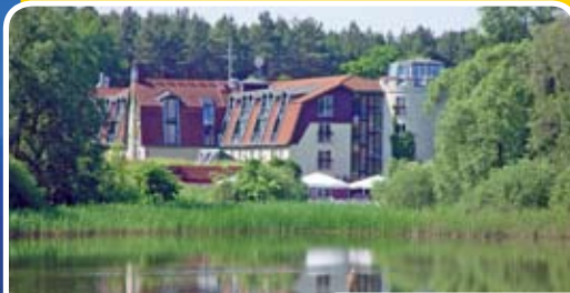
Blick vom Beetzer See auf das Wellness-Hotel & SPA Sommerfeld

F reuen Sie sich auf Traumtage am Beetzer See in Brandenburg . Genießen Sie die Natur beim Nordic Walking, Radeln oder Wandern. Gewinnen Sie das Arrangement „Champagner Gruß“ im Hotel & SPA Sommerfeld für zwei Personen inkl. zwei Übernachtungen im Doppelzimmer, Frühstücks-Bufett, zwei Abendessen, prickelndem Champagner-Gruß sowie Nutzung des ANIMA-SPA.* ( www.wellness.hotel-sommerfeld.de )