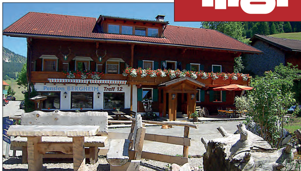
Schönes Ambiente: Ruhig am Ortsrand von Tannheim gelegen: Die gemütliche Pension Bergheim PS.

Für die Biker aus allen Himmelsrichtungen ist das