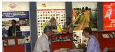
Die Niederlande punkteten u. a. mit der Floriade im nächsten Jahr

WorkNet ist eine kostenlose Verkaufs- und Angebotsplattform und exklusiv den Ausstellern des aktuellen RDA-Workshops vorbehalten. Aussteller haben ab dem 4. August 2011 die Möglichkeit sich auf der Plattform zu registrieren und Ihre eigenen Angebote zu veröffentlichen. Die Exklusivität wird durch die Kontaktdaten im Angebot gewährleistet, die ausschließlich vom RDA-System eingegeben werden und den Anmeldeinformationen der Aussteller des Jahres 2011 entsprechen.