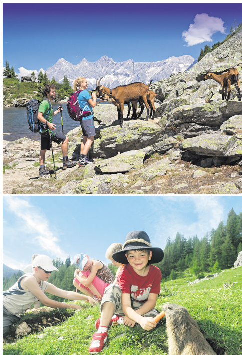
Entspannung für Erwachsene und ultimative Action für Kinder stehen hier auf dem Tagesprogramm!