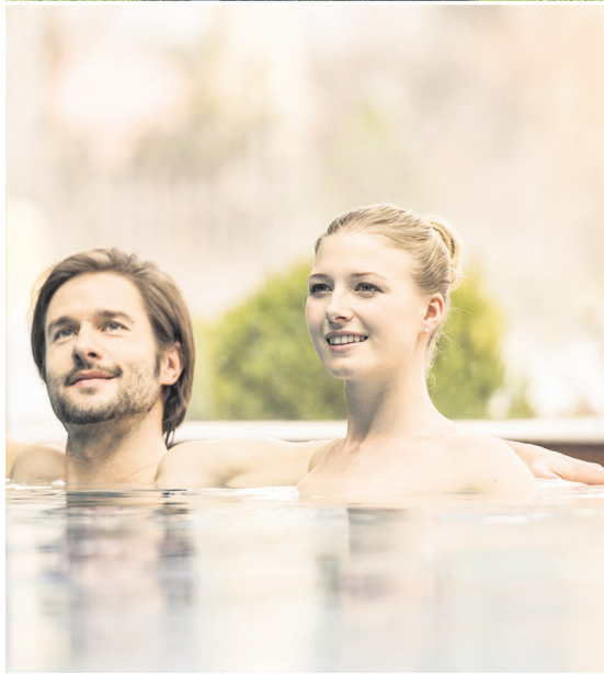
Hier findet jeder seinen Lieblingsplatz: In Ebner's Waldhof am See