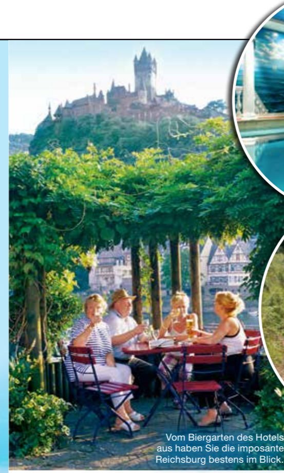
Vom Biergarten des Hotels aus haben Sie die imposante Reichsburg bestens im Blick.