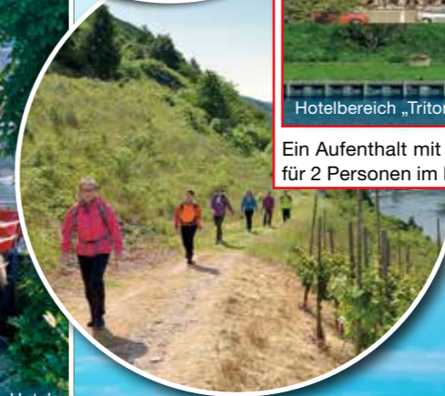
Mittelpunkt des Ferienlandes Cochem und bekannt für Weinvielfalt & Kulinarik: Die Stadt Cochem.

Ein Aufenthalt mit 4 Übernachtungen im Doppelzimmer inklusive Frühstück für 2 Personen im Moselstern Hotel Brixiaide & Triton.