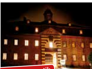
Schlossromantik am Mittelrhein