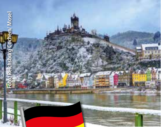
Foto: Reichsburg Cochem / Mosel