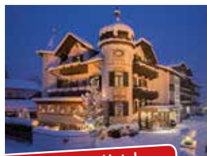
Das Genießer-Hotel im Herzen von Garmisch

Das exklusive ****S Genießerhotel bietet seinen Gästen „Mehr Berg | Mehr Balance | Mehr Genuss“ mit viel Herz und Charme. Feinste Lebensart am Fuße der Zugspitze. Entdecken Sie zusätzlich den Charme und die Ästhetik eines über 350 Jahre alten „Werdenfeller Bauernhauses“ in Verbindung mit einer stilvoll authentischen Einrichtung.