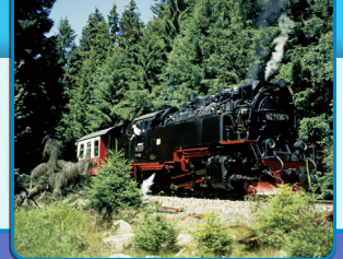
Immer ein Highlight: die Dampfloks der Harzer Schmalspurbahn