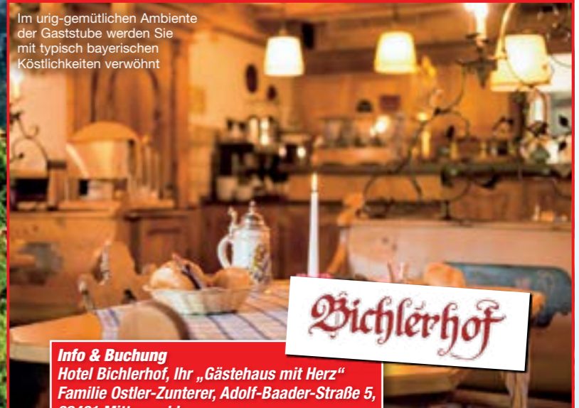
Im urig-gemütlichen Ambiente der Gaststube werden Sie mit typisch bayerischen Köstlichkeiten verwöhnt