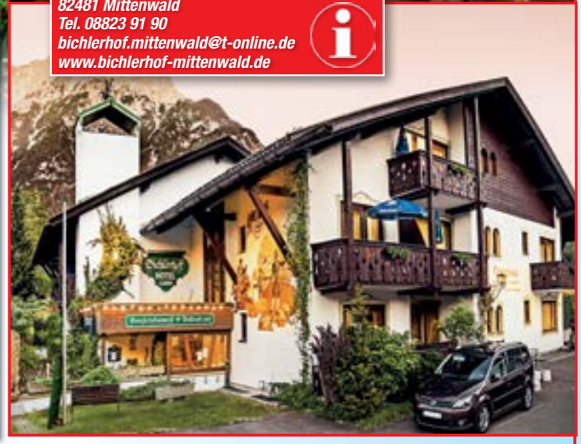
Wir danken unseren Kooperationspartnern für die unentgeltliche Zurverfügungstellung der Sachpreise.