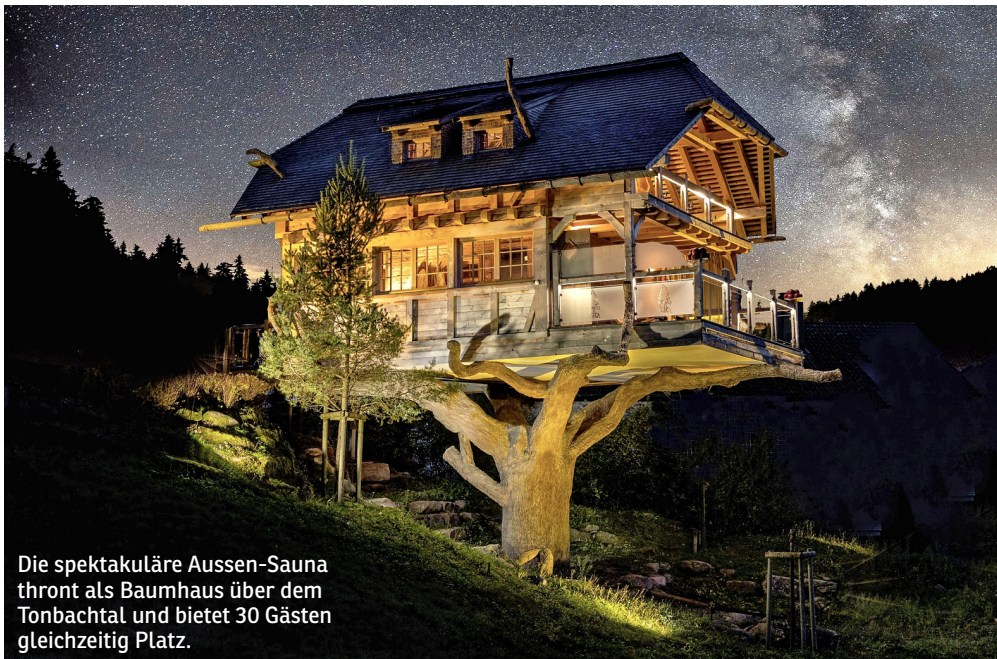
Die spektakuläre Aussen-Sauna thront als Baumhaus über dem Tonbachtal und bietet 30 Gästen gleichzeitig Platz.