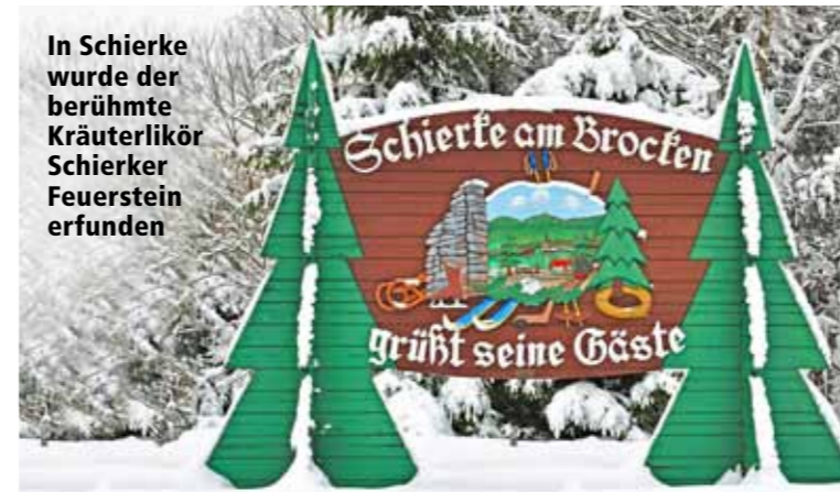
In Schierke wurde der berühmte Kräuterlikör Schierker Feuerstein erfunden