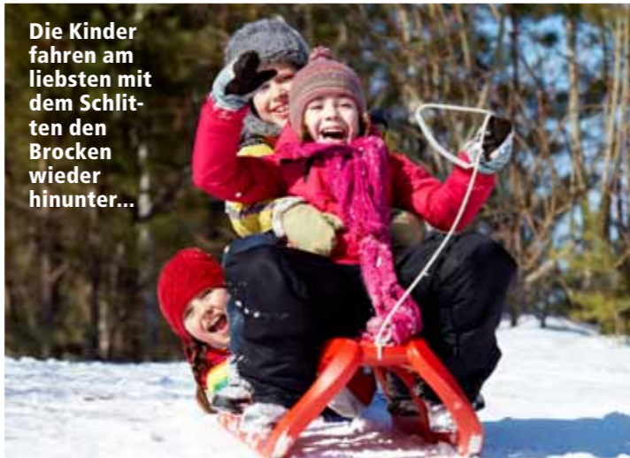
Die Kinder fahren am liebsten mit dem Schlitten den Brocken wieder hinunter...