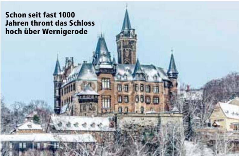
Schon seit fast 1000 Jahren thront das Schloss hoch über Wernigerode