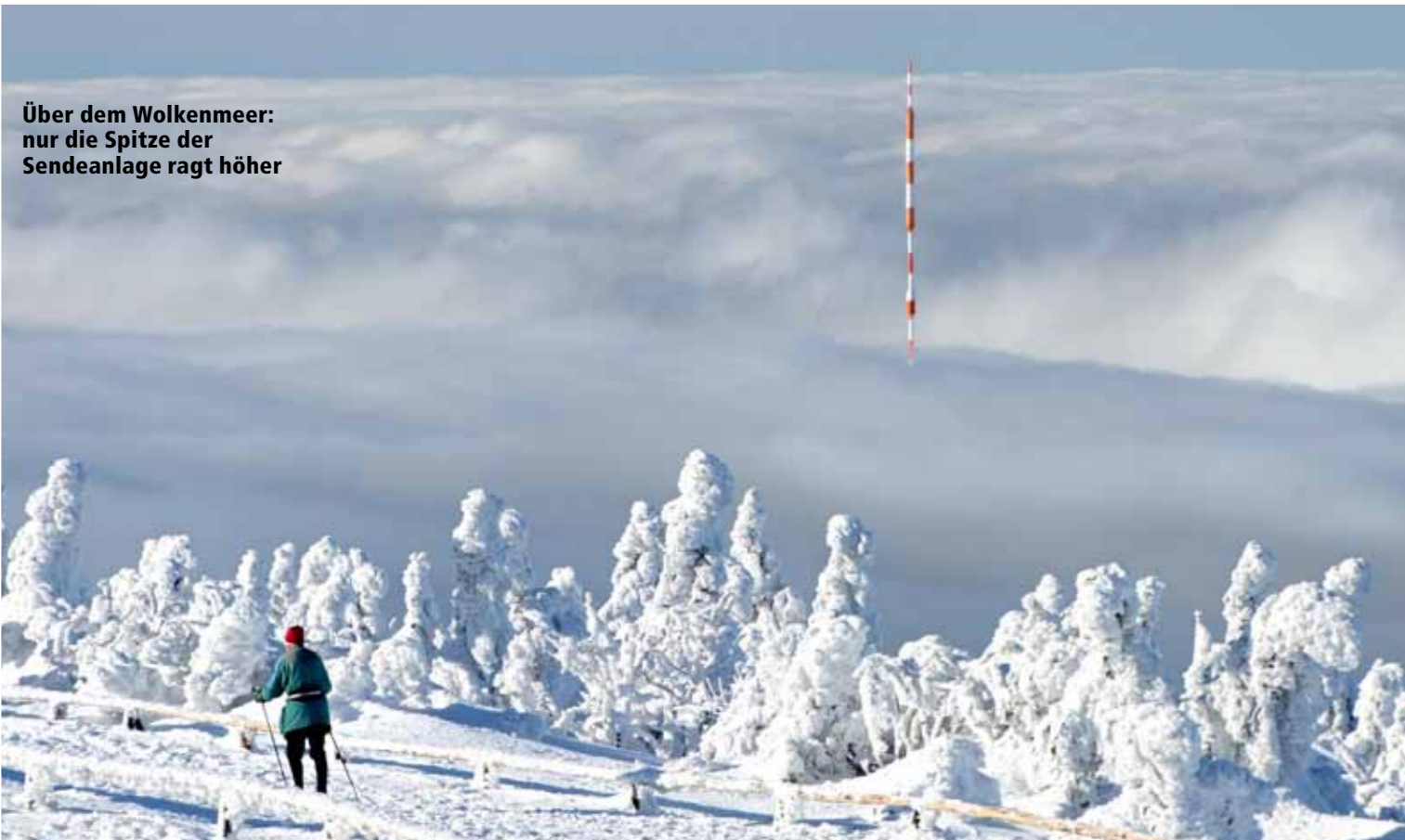
Über dem Wolkenmeer: nur die Spitze der Sendeanlage ragt höher