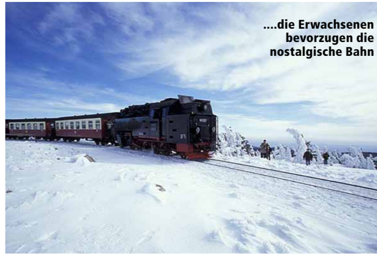
...die Erwachsenen bevorzugen die nostalgische Bahn