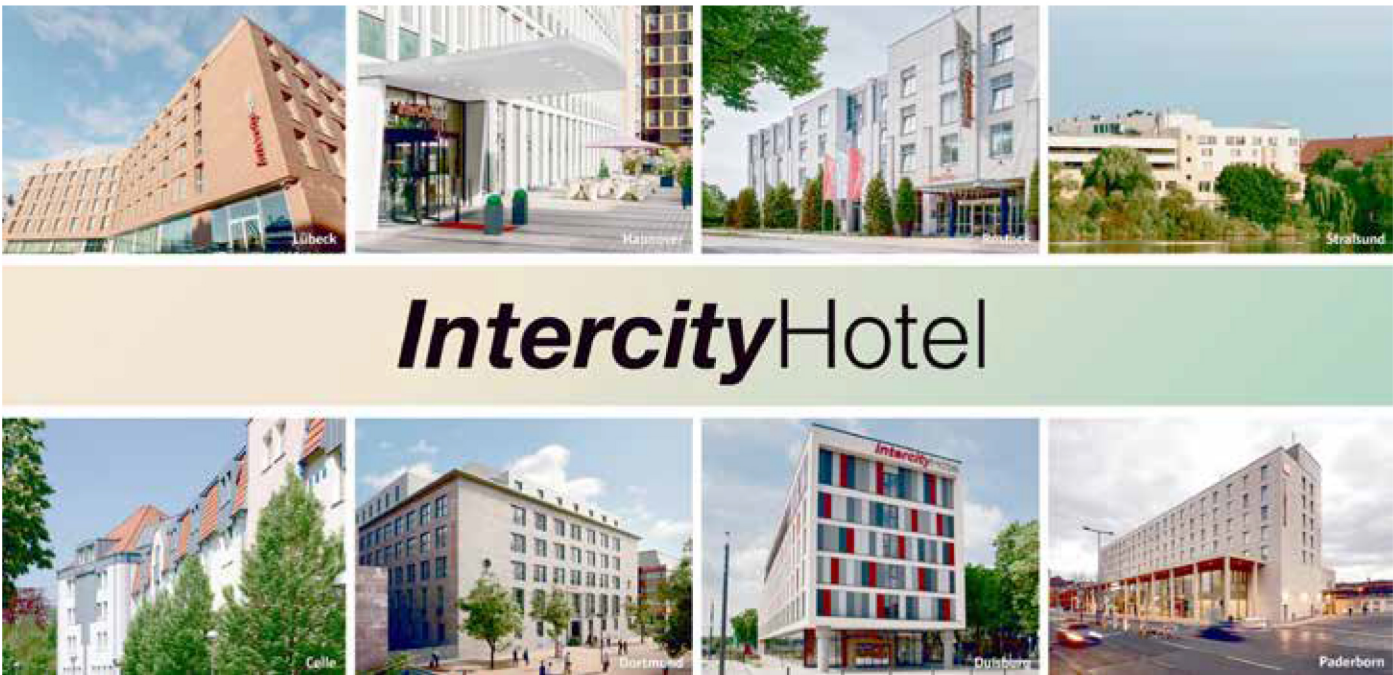
Die 8 IntercityHotels liegen alle sehr zentral und sind mit der Bahn schnell und bequem erreichbar.

Metropolregion Rhein-Ruhr Beide Städte verzaubern mit ihrem einzigartigen Angebot – Duisburg mit dem Landschaftspark Nord, beeindruckender Industriekultur, dem größten Binnenhafen Europas und der begehbaren Achterbahn Tiger