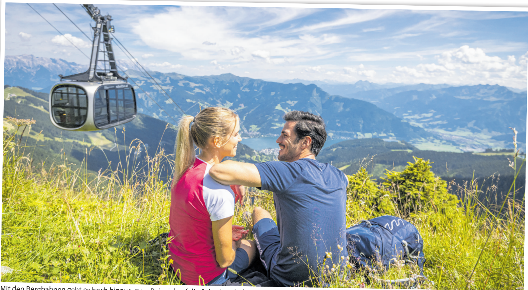
Mit den Bergbahnen geht es hoch hinaus, zum Beispiel auf die Schmittenhöhe mit Blick auf den Zeller See.