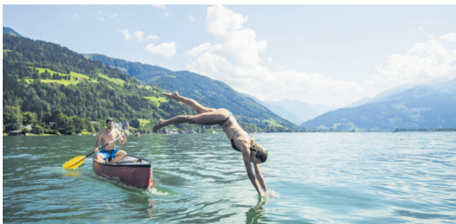
Im Sommer bieten die Strandbäder am Zeller See herrliche Abkühlung.

Weitere Vergünstigungen gibt es unter anderem beim Abenteuer Golf Woferlgut, beim Bogenparcours Glemmerhof, im Glemmy Offroad Park, bei einem Tandemgleitschirmflug ab dem Schattberg in Saalbach oder gar bei einer Raftingtour an der Saalach.