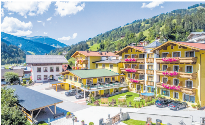
Hier übernachten die Gewinner: Das Hotel Oberwirt ist das Daheim in den Salzburger Bergen.