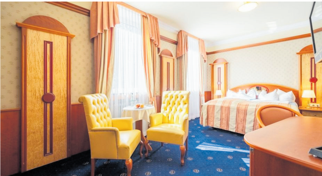
Die eleganten Zimmer und Suiten versprühen das Flair eines Grand Hotels.