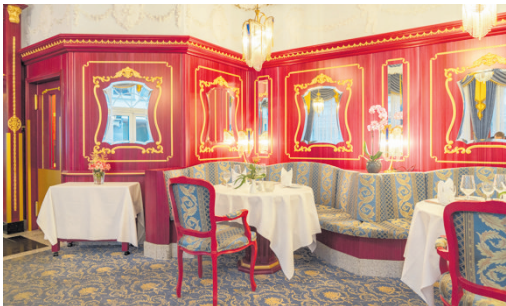
Im stilvollen Restaurant erleben Gäste die kulinarische Vielfalt der Vulkaneifel Region.