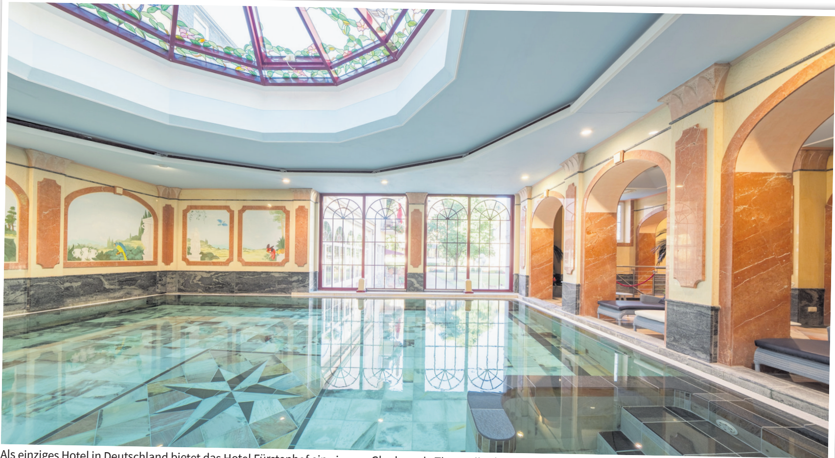
Als einziges Hotel in Deutschland bietet das Hotel Fürstenhof ein eigenes Glaubersalz-Thermalbad.