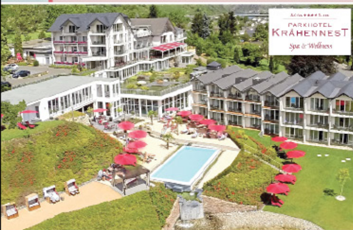
PARKHOTEL KRÄHENNEEST Spa & Wellness