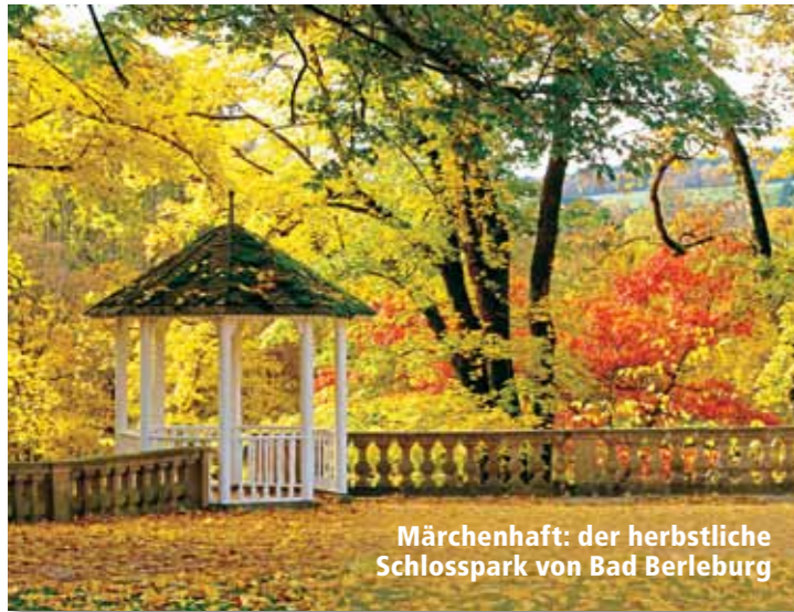
Märchenhaft: der herbstliche Schlosspark von Bad Berleburg