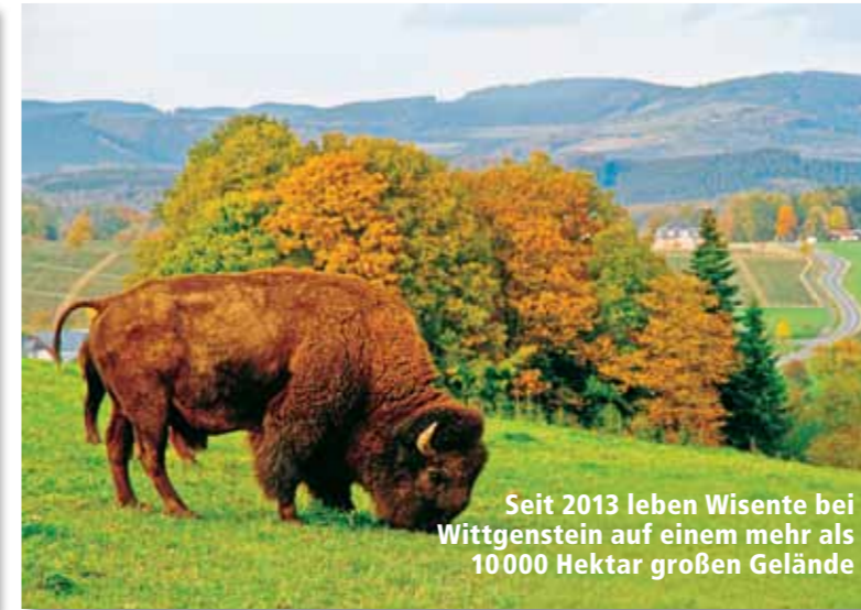
Seit 2013 leben Wisente bei Wittgenstein auf einem mehr als 10000 Hektar großen Gelände