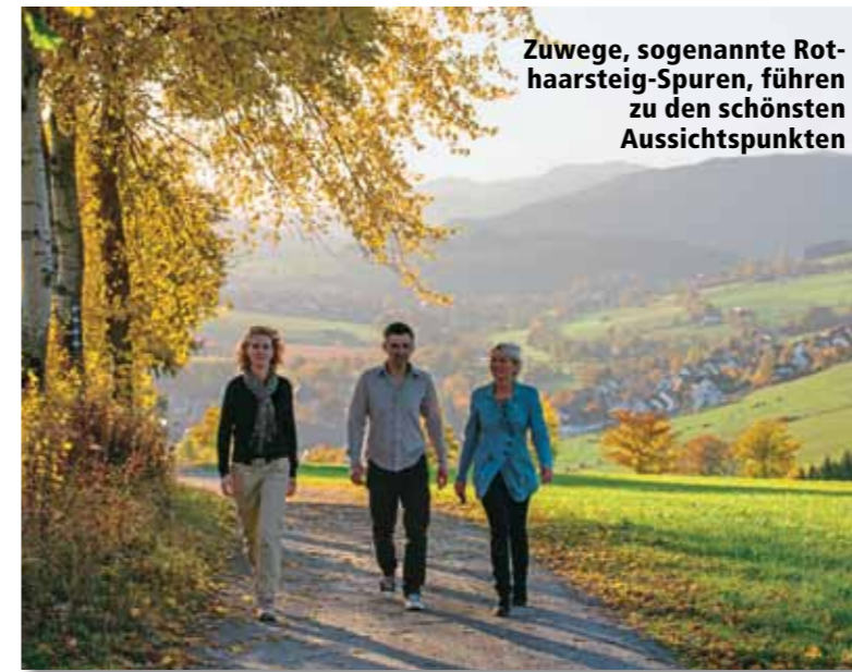
Zuwege, sogenannte Rothaarsteig-Spuren, führen zu den schönsten Aussichtspunkten