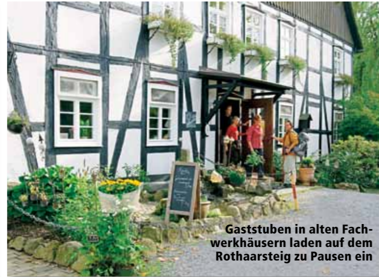
Gaststuben in alten Fachwerkhäusern laden auf dem Rothaarsteig zu Pausen ein