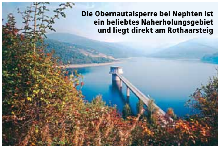
Die Obernautalsperre bei Nephten ist ein beliebtes Naherholungsgebiet und liegt direkt am Rothaarsteig