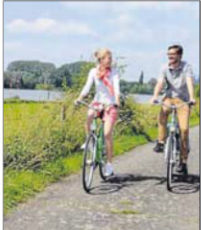
Eine Fahrradtour am Rhein bietet die perfekte Erholung, hier bei Xanten.

Information und Katalogbestellung unter Telefon 02162/817903, per E-Mail an info@niederrhein-tourismus.de sowie über die Internetseite www.niederrhein-tourismus.de.