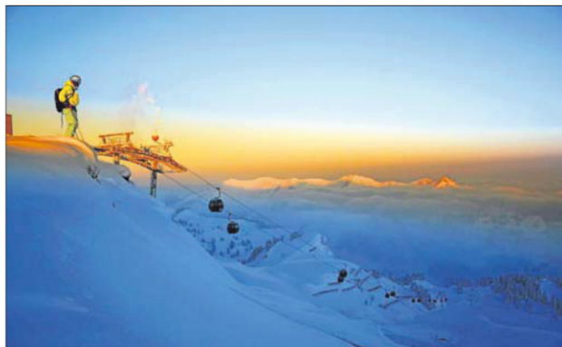
In Mellau-Damüls finden Wintersportler perfekt präparierte Pisten und sichere Pulverschneehänge für Freerider sowie sonnige Langlaufloipen.

Für Groß und Klein ein ganz besonderes Erlebnis ist die Tunnel-Abfahrt. Sie führt von der Bergstation der Gipfelbahn oder Sesselbahn Hohe Wacht auf die Mellauer Roßstelle. Dabei fahren alle Brettflans durch den 120 Meter langen Skitunnel, der die Verbindung zwischen Mellau und Damüls ermöglicht. Skifahren im Berg, das darf man nicht entgehen lassen. Auch kulinarisch wird für Wintersportfans einiges geboten: Tolle Bergrestaurants,