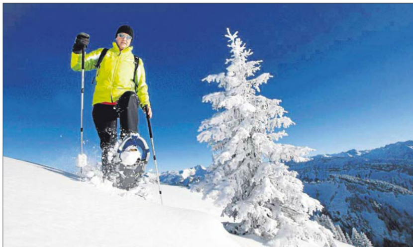
Schneeschuhwandern in der traumhaften Winterlandschaft des Bregenzerwaldes ist der perfekte Ausgleich für Ruhesuchende.

Wer dem Winter ein Schnäppchen schlagen möchte, kann sich auf ba.com auch komplette Urlaube einschließlich unvergesslicher Erlebnisse zusammenstellen. Sparrfüche können ausgewählte Kombinationen aus Flug und Hotel oder Flug und Mietwagen noch bis zum 27. Januar auf ba.com bis zu 20 Prozent günstiger buchen. Ob Weltenbummler oder Sonnenanbeter, jeder findet seine Traumdestination. Zum Beispiel nach New York ab 490 Euro, nach San Francisco ab 689 Euro oder nach Kapstadt zum Preis ab 659 Euro.